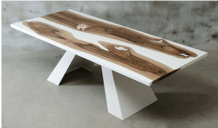
Table Omega En Noyer Massif Et Résine