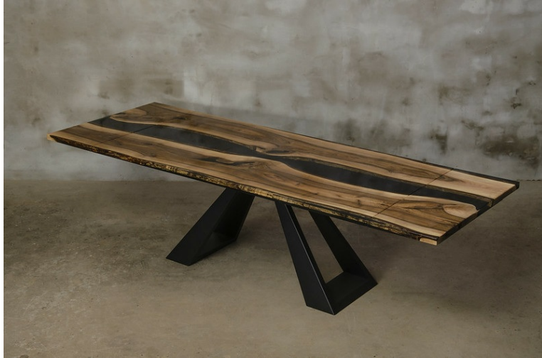
Table Profundum Extensible