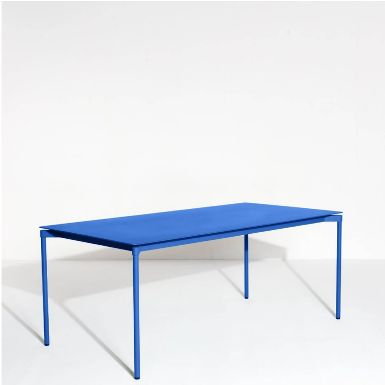
Table rectangulaire FROMME

La table rectangulaire Fromme se démarque par sa ligne pure et profilée , et s'adapte à un usage en extérieur .