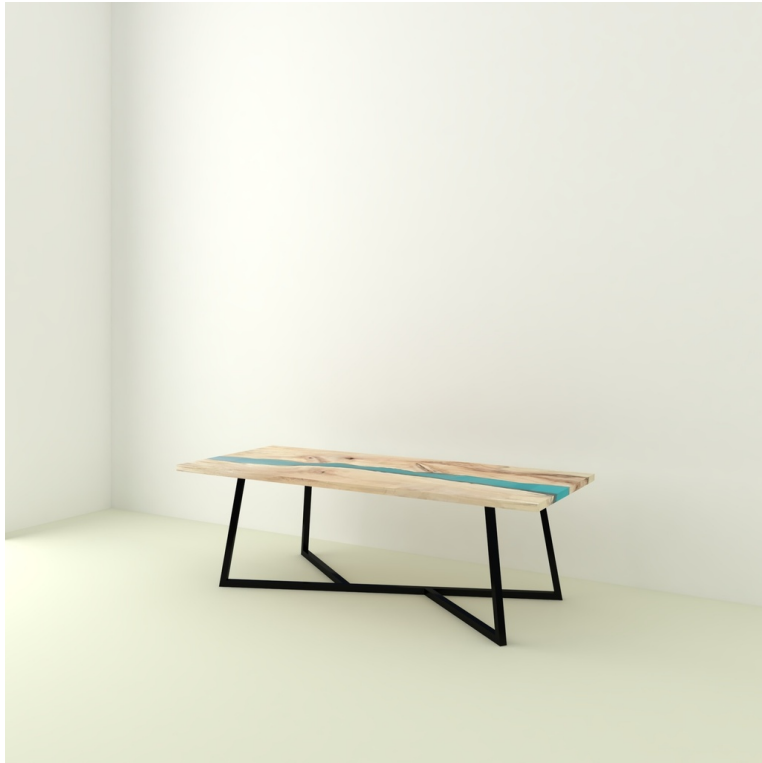
Table River Orme Et Résine Epoxy pieds Asymétriques