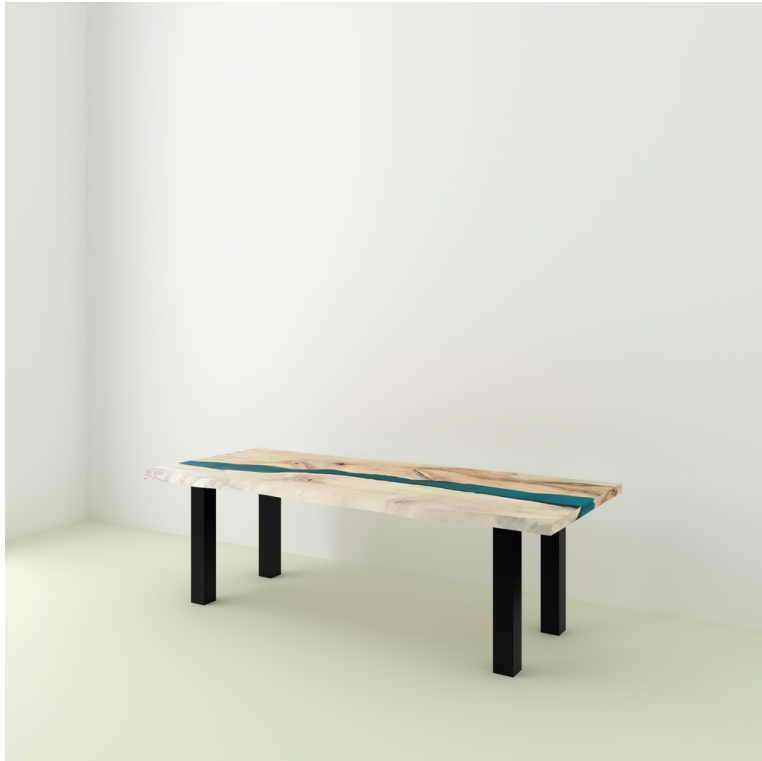
Table River Orme Et Résine Epoxy pieds Carrés