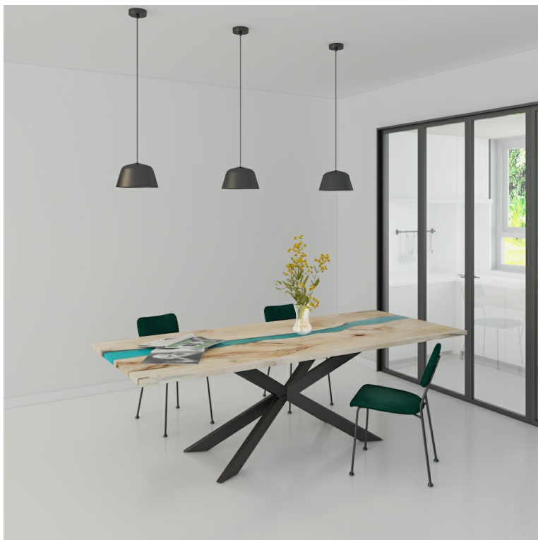
Table River Orme Et Résine Epoxy pieds Croix