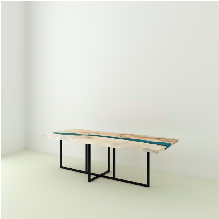
Table River Orme Et Résine Epoxy pieds Felix