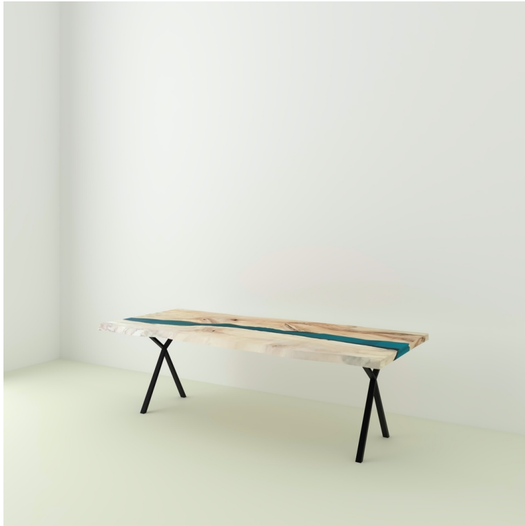
Table River Orme Et Résine Epoxy pieds Lachaud