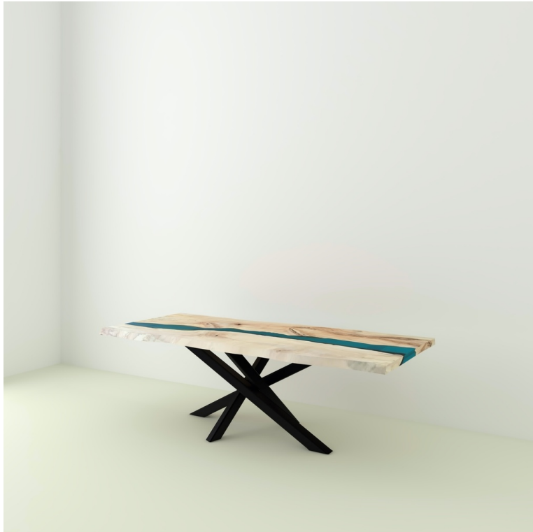
Table River Orme Et Résine Epoxy pieds Mikado