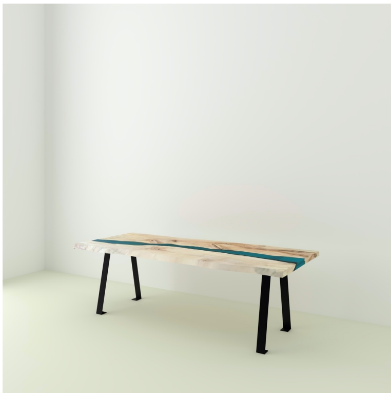
Table River Orme Et Résine Epoxy pieds Scandinave A