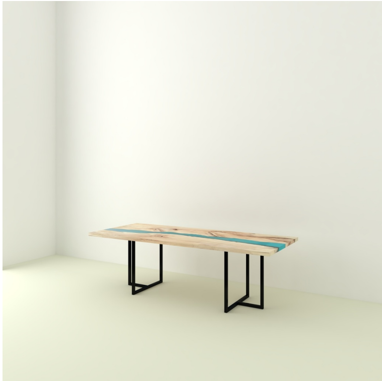
Table River Orme Et Résine Epoxy pieds T