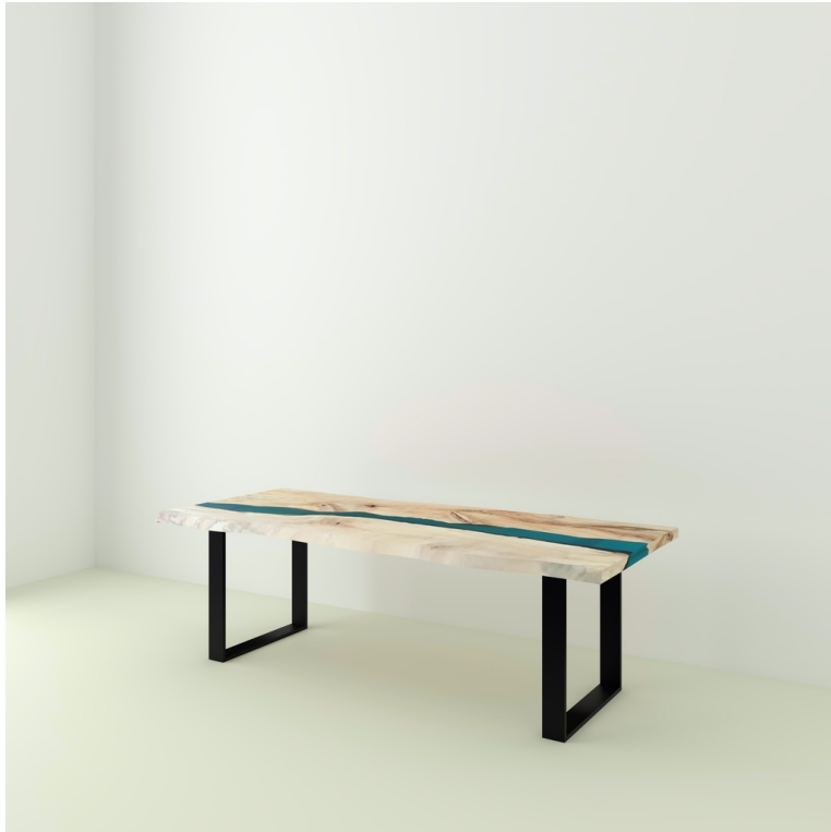
Table River Orme Et Résine Epoxy pieds U Plat