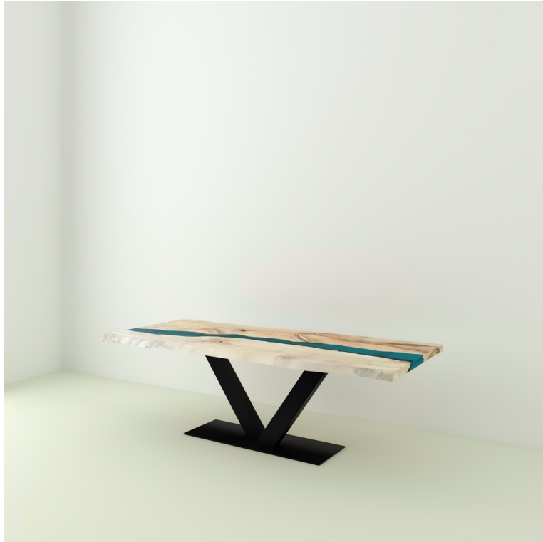
Table River Orme Et Résine Epoxy pieds V Carré