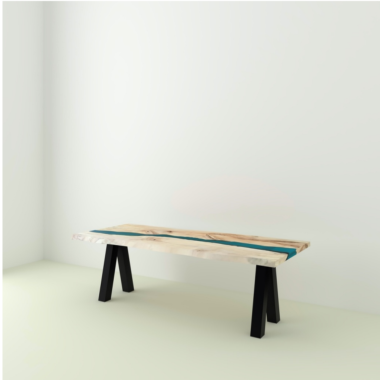
Table River Orme Et Résine Epoxy pieds V Inversés