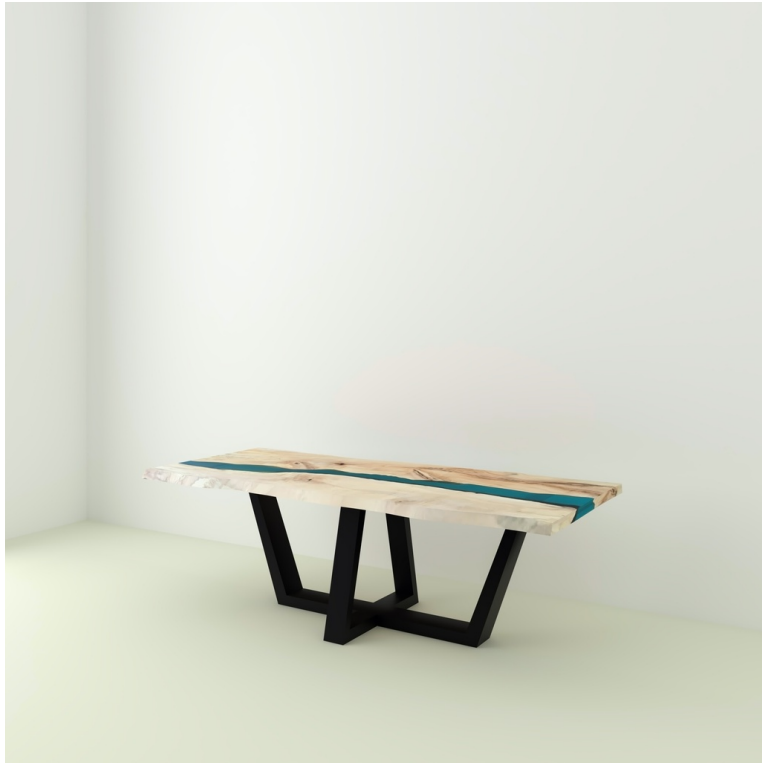
Table River Orme Et Résine Epoxy pieds W