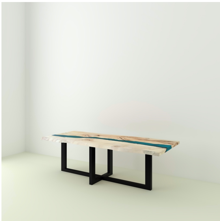
Table River Orme Et Résine Epoxy pieds W Droit