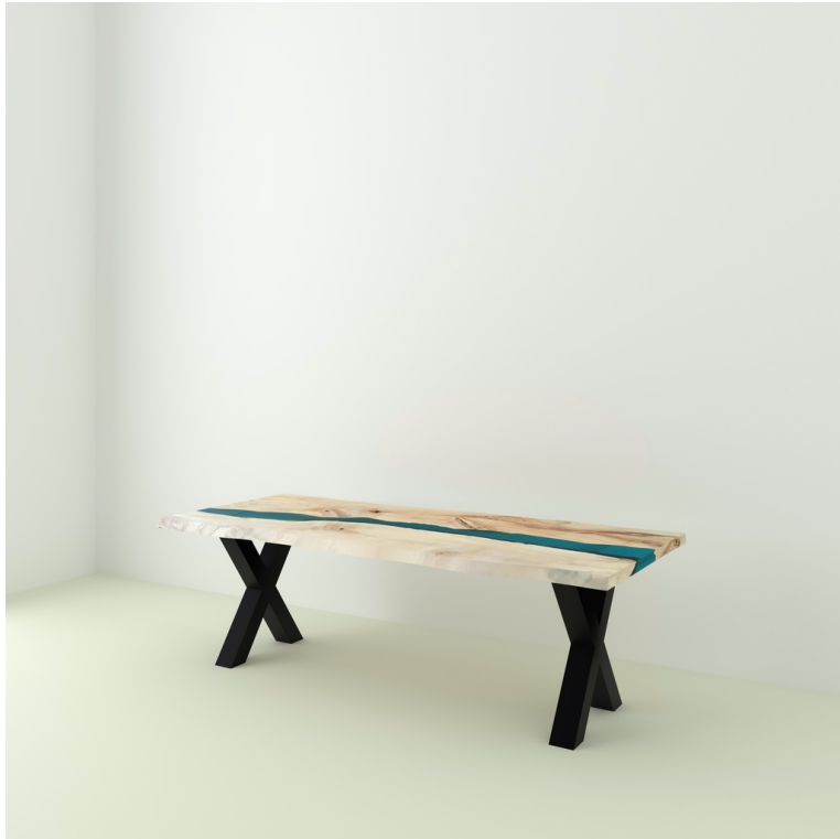
Table River Orme Et Résine Epoxy pieds X