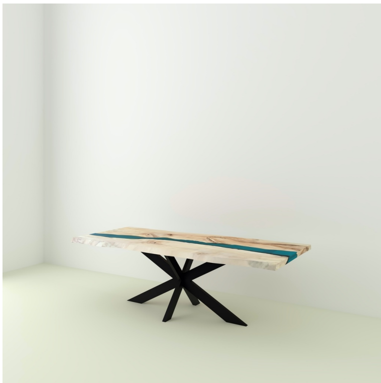
Table River Orme Et Résine Epoxy pieds XX