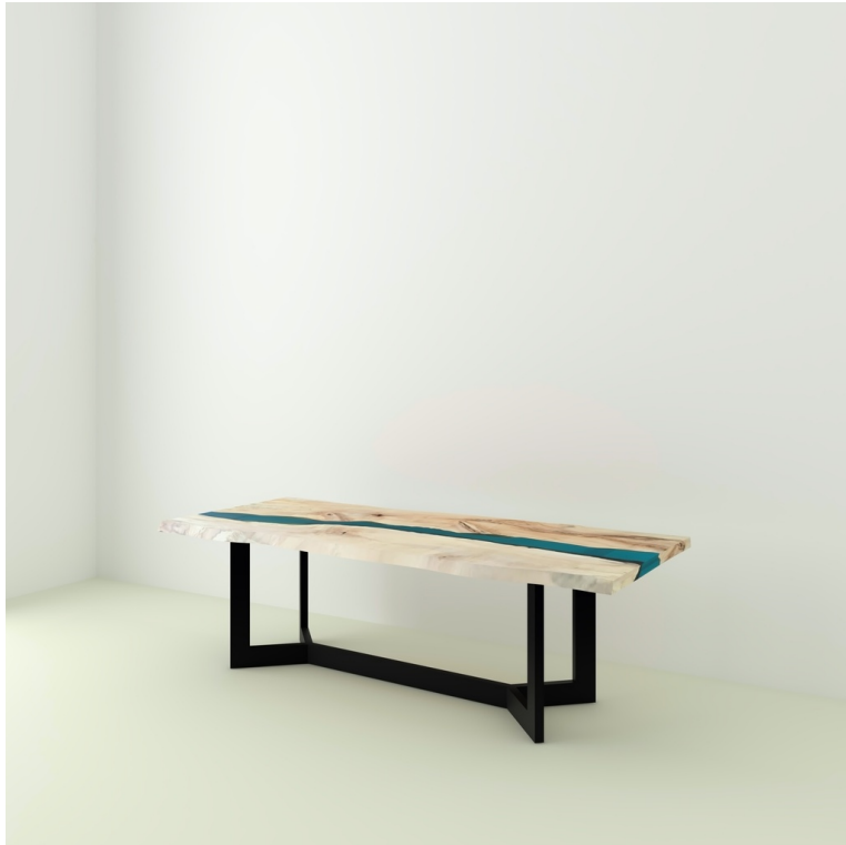
Table River Orme Et Résine Epoxy pieds Y