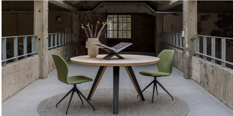
Table Ronde Manhattan