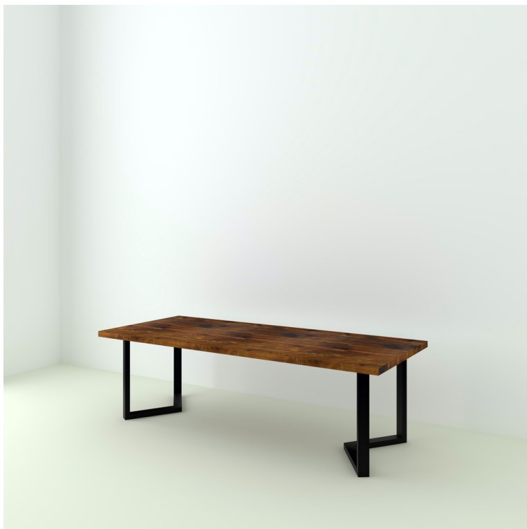
Table Sarlat Sapin Recyclé pieds Chevron