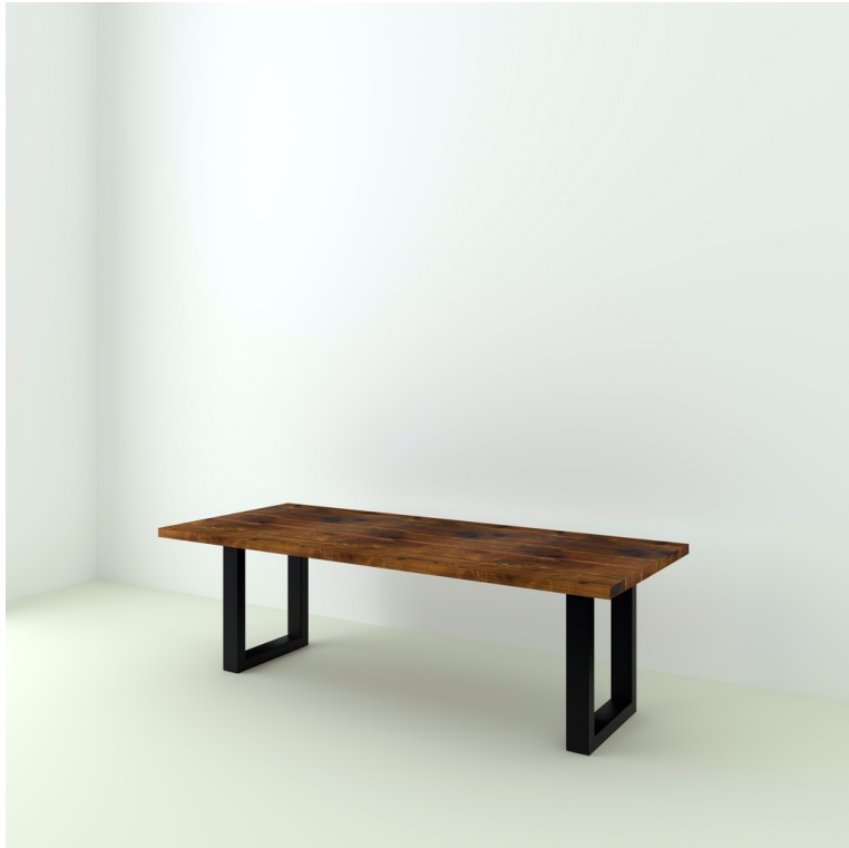
Table Sarlat Sapin Recyclé pieds O