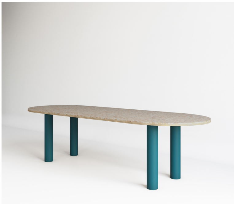
Table Saturne En Terrazzo De Bois pieds Tube Métal