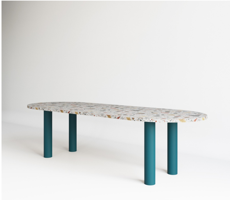
Table Saturne En Terrazzo pieds Tube Métal