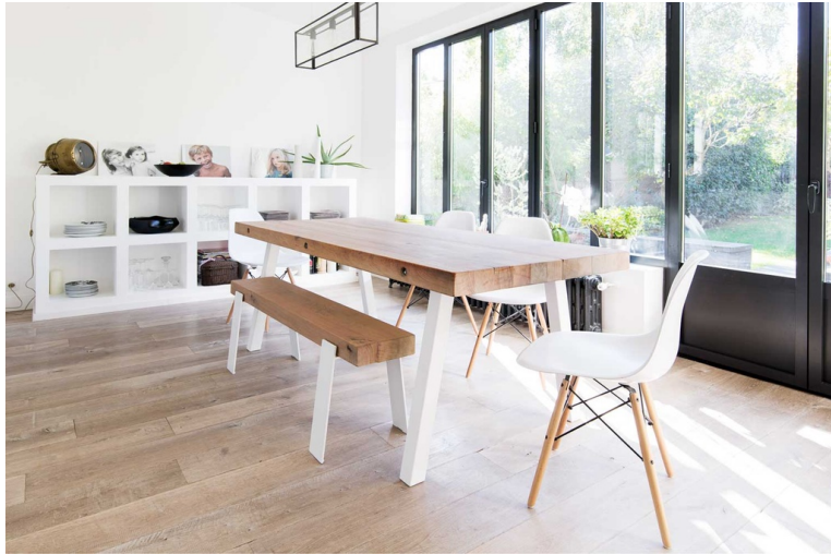
Table Stockholm Poutres De Chêne Vieillies