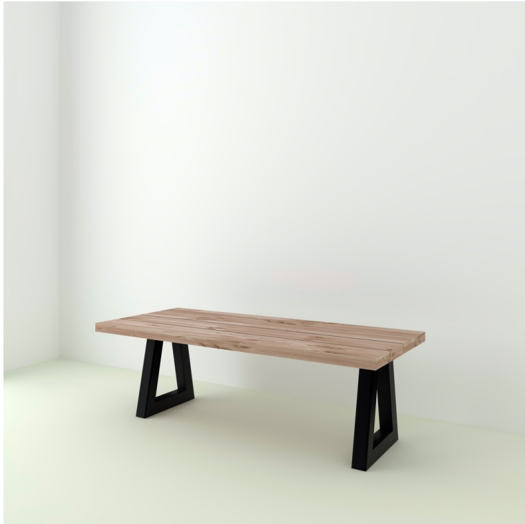
Table Toronto Douglas pieds Trapeze