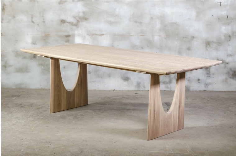
Table Wabi En Chêne Massif