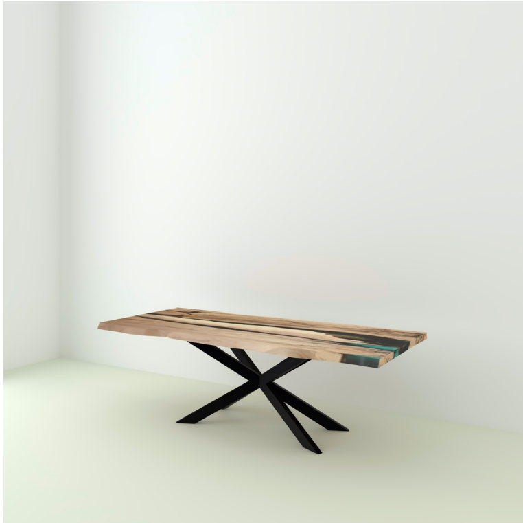
Table Wild Résine Epoxy pieds Croix