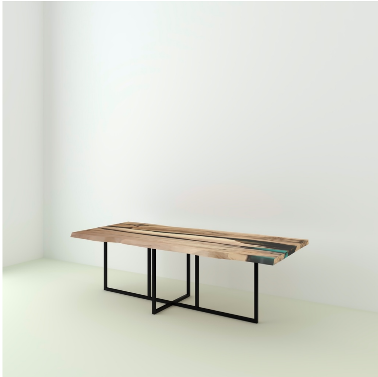
Table Wild Résine Epoxy pieds Felix