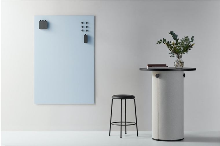
Tableau en verre magnétique Magvision

A la fois moderne et fonctionnel , le tableau mural Magvision est l'équipement très utile pour vos salles de réunion ou de coworking.