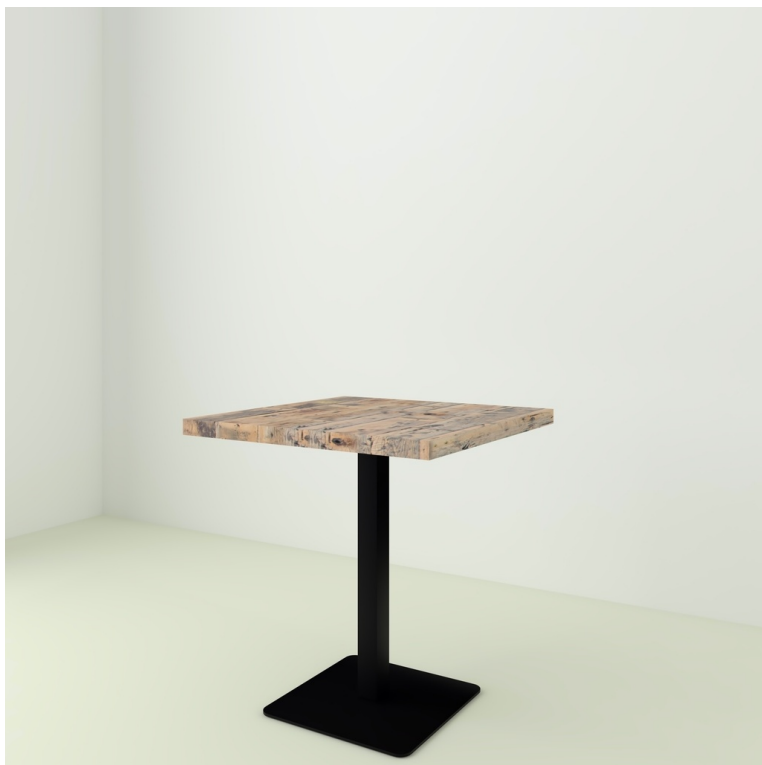
Table Bistrot Plancher De Wagon pieds Classique 3 pieds