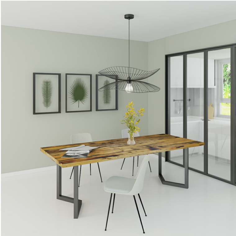
Table Arya pieds Chevrons