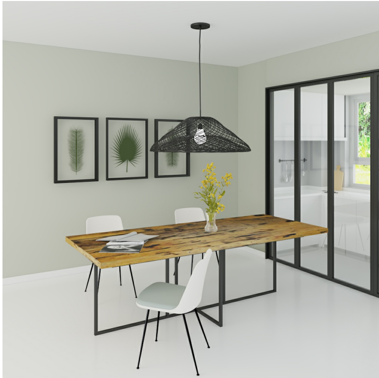
Table Arya pieds Felix