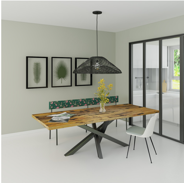
Table Arya pieds Mikado