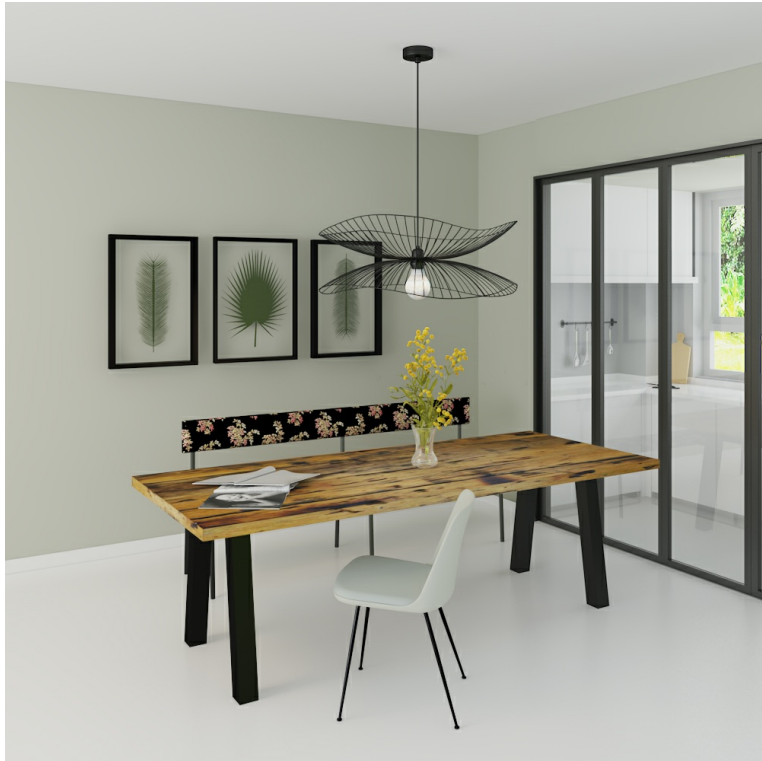
Table Arya pieds Non Parallèles