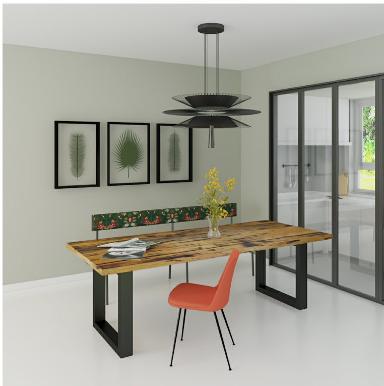
Table Arya pieds O