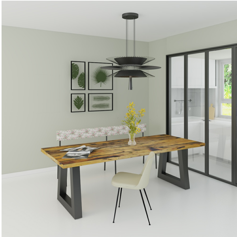
Table Arya pieds Trapèze