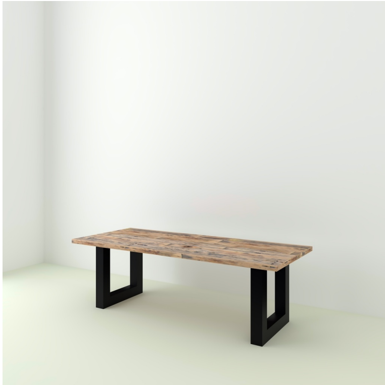
Table Arya pieds U