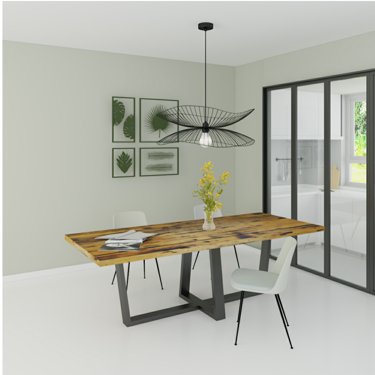
Table Arya pieds W