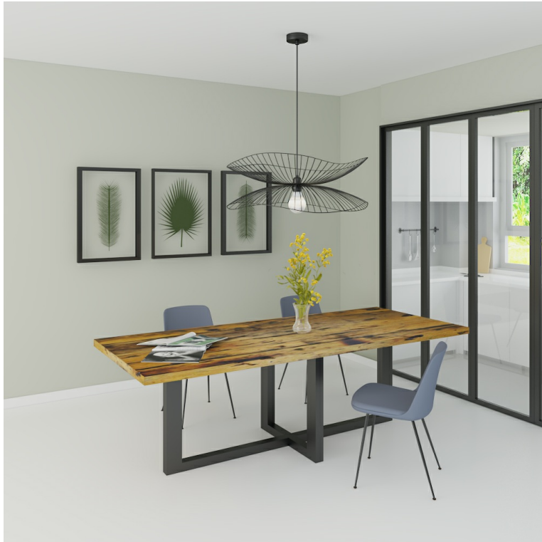
Table Arya pieds W Droit