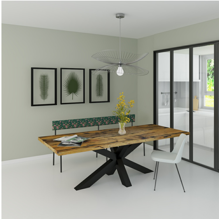
Table Arya pieds XX