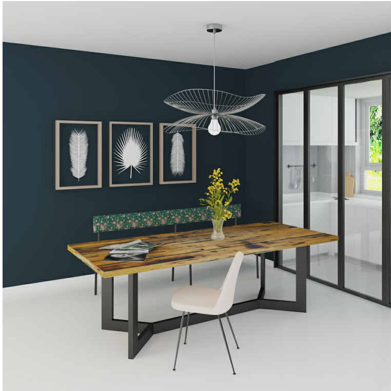
Table Arya pieds Y